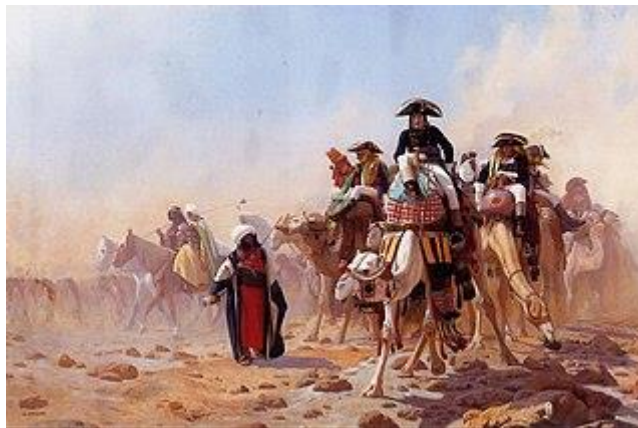
Jean-Léon Gérôme (1867): Napoleon en zijn generale staf in Egypte

Egypte was onderdeel van het Ottomaanse Rijk maar werd in feite al vele eeuwen geregeerd door de mammelukken , eerst onafhankelijk en sinds de 16e eeuw in naam van het Ottomaanse Rijk. De mammelukken waren een soort militaire kaste die als ridders te paard vochten.