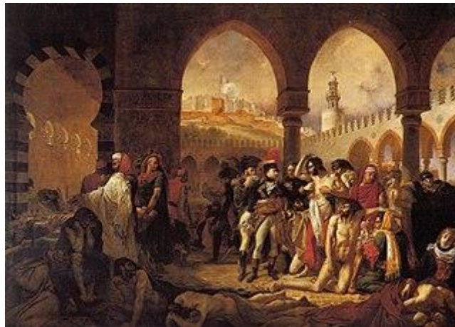
Antoine-Jean Gros (1804): Bonaparte bezoekt het pesthuis in Jaffa

Toen het nieuws van de Franse nederlaag in de Slag bij de Nijl de Ottomaanse hoofdstad Istanboel bereikte, verklaarde sultan Selim III de oorlog aan Frankrijk en stuurde twee legers naar Egypte om af te rekenen met Napoleon. Het ene leger zou onder leiding van Jezzar Pasja aanvallen vanuit Palestina, en het andere leger zou inschepen op Rodos en op de Egyptische kust landen.